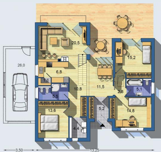
PRÍZEMIE [celková plocha 120.6 m 2 ]