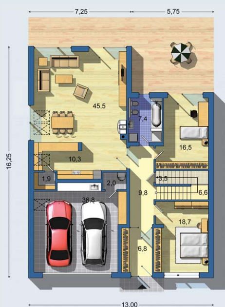
PRÍZEMIE [celková plocha 165.2 m 2 ]