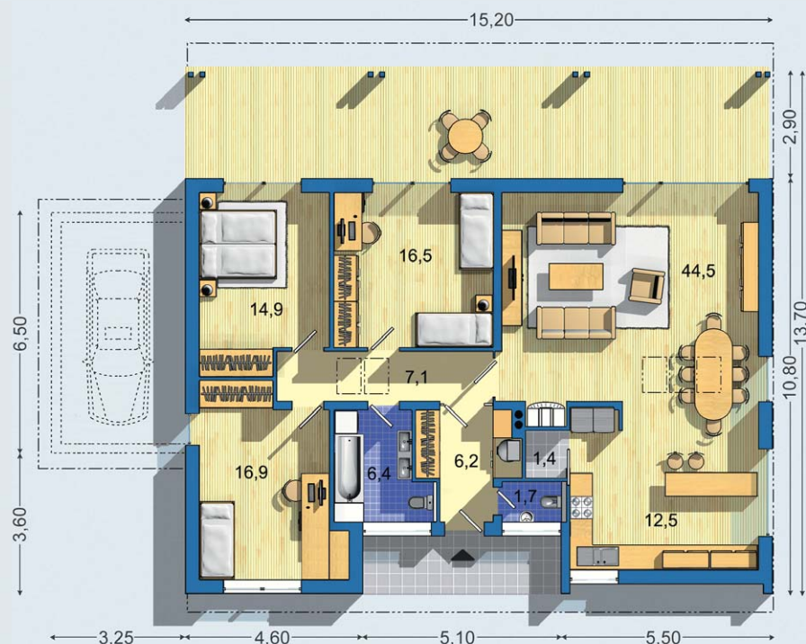
PRÍZEMIE [celková plocha 128.0 m 2 ]