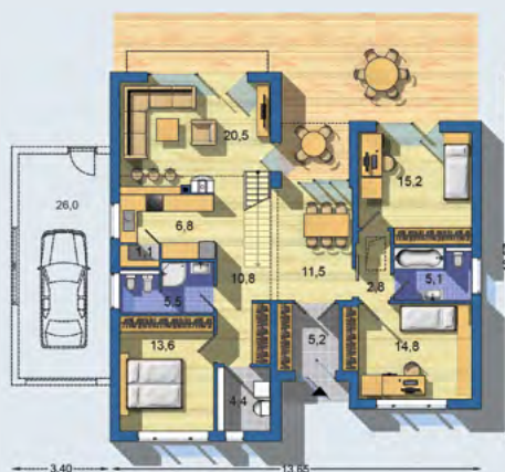
PRÍZEMIE [celková plocha 120.6 m 2 ]

BUNGALOV 1774 - moderný atypický bungalov s obytným podkrovmím nad polovicou pôdorysu - veľká izba v podkroví, s vlastnou kúpeľňou a prístupom z obývacej izby môže slúžiť ako hosťovská alebo pracovňa - zvýšený priestor nad obývacou izbou doplní atraktívna galéria - kuchyňa je čiastočne spojená s obývačkou, veľká samostatná jedáleň nadväzuje na čiastočne krytú terasu - detské izby s vlastnou kúpeľňou tvoria samostatnú oddelenú časť domu - v časti neobytného podkrovia je navrhnutý odkladací priestor . . .