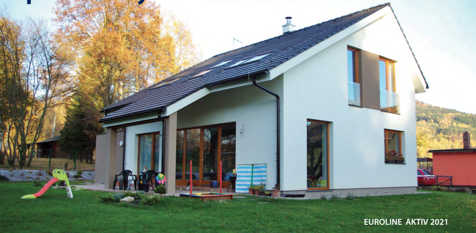
EUROLINE AKTIV 2021

Mladý pár mal o svojom budúcom bývaní jasnú predstavu. Chceli bývať v rodinnom dome a tiež zostať neďaleko niektorého z rodičov. Majiteľ je zo Slovenska, majiteľka z Čiech. Nakoniec si pre svoj život vybrali rodné mestečko majiteľky, pretože obidvom sa naskytila možnosť pracovať v neďalekom meste.