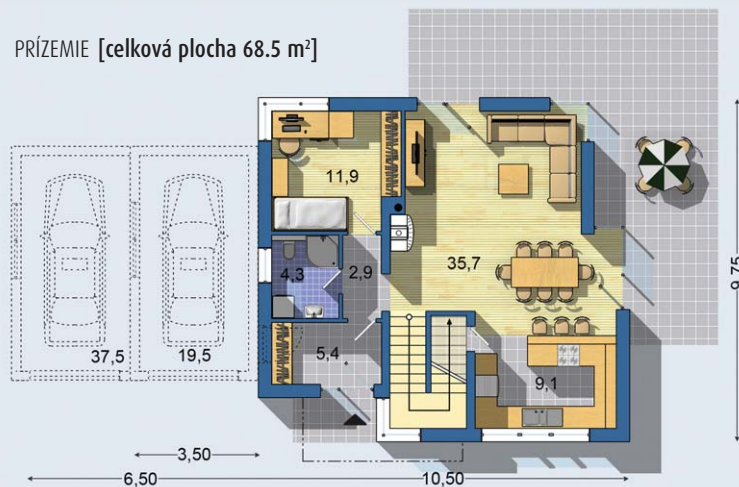
PRÍZEMIE [celková plocha 68.5 m 2 ]